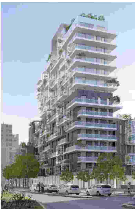
Il rendering del nuovo grattacielo

Nuova iniziativa imprenditoriale cinese: la struttura sorgerà in via Pirelli non lontano dalla Centrale